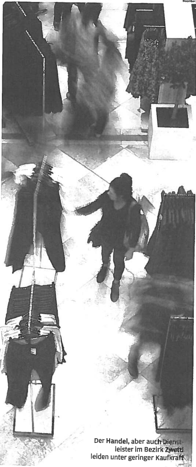
Der Handel, aber auch Dienstleistungen im Bezirk Zwettl leiden unter geringer Kaufkraft