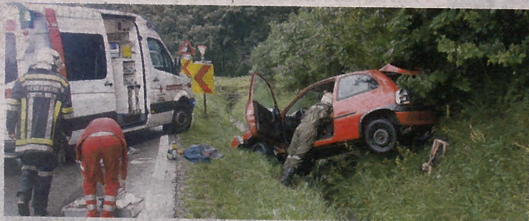
Vom roten Opel Corsa blieb beim Abflug in den Straßengraben nicht viel übrig.