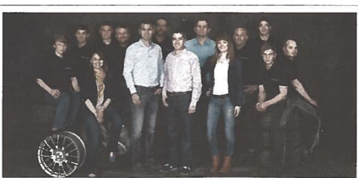
Mehr Informationen und über unser Team finden Sie auf www.eckerundsinhuber.at.